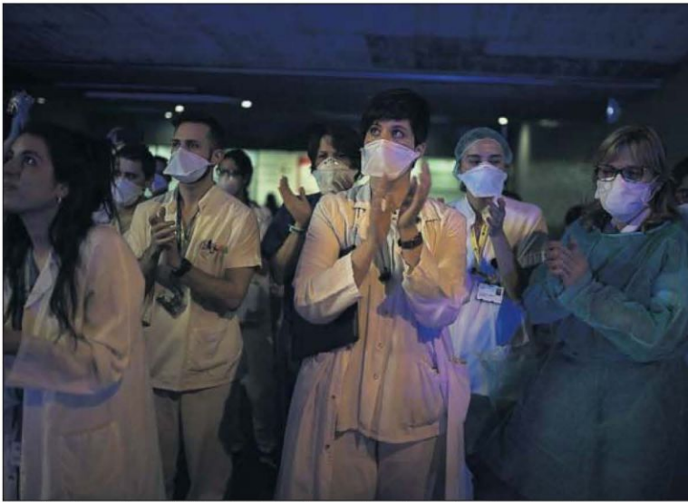
Profesionales sanitarios del Hospital de Sant Pau, en Barcelona, salen a las ocho de la tarde de ayer a devolver los aplausos que les dedican ciudadanos desde sus balcones en toda la ciudad.