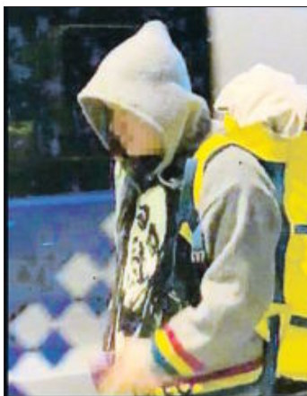
Un dels ocupes abandonant l'immoble

Els ocupes van entrar al bloc del costat per saltar d'un terrat a l'altre